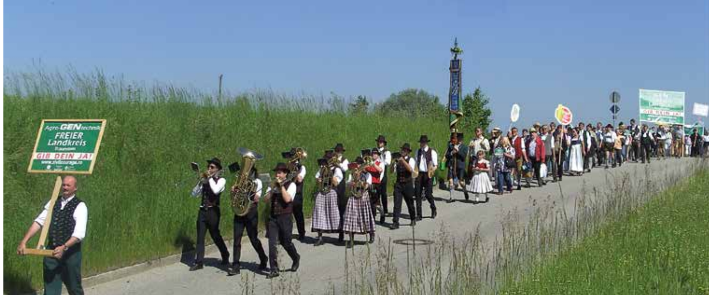
Demonstrationszug der Initiative Zivilcourage gegen Gentechnik, 2008, Rosenheim

die einzig sinnvolle Maßnahme zu sein. Allen waren nur die angeblichen Vorteile von Agro-Gentechnik bekannt gemacht worden. Über die unweigerlich folgende Abhängigkeit von den Großkonzernen, die Auswirkungen für die Landwirt*innen in den ärmeren Regionen der Welt, die steigenden Einsatzmengen von Pflanzenschutzmitteln und die unabsehbaren Risiken einer Freisetzung von gentechnisch veränderten Organismen waren sie bewusst getäuscht worden. EM-Chiemgau baute eine Kampagnen-Website mit Detailinformationen zu den Hintergründen von Agro-Gentechnik auf, die bald zur Referenz wurde. Über 30.000 Menschen hinterließen namentlich im Internet ein Statement zur Agro-Gen Technik, damals eine unglaublich hohe Zahl!