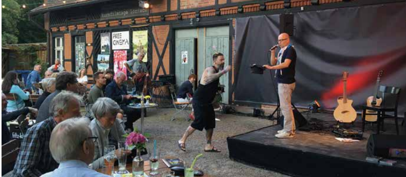
Soziokultureller Treffpunkt im Selbsteigentum

kleinen Bühne. In einem der zwei Nebengebäude befindet sich ein Theatersaal mit Foyer und Bar, der auch für mittelgroße Workshops, Vorträge, Musik- und Tanzveranstaltungen genutzt werden kann.