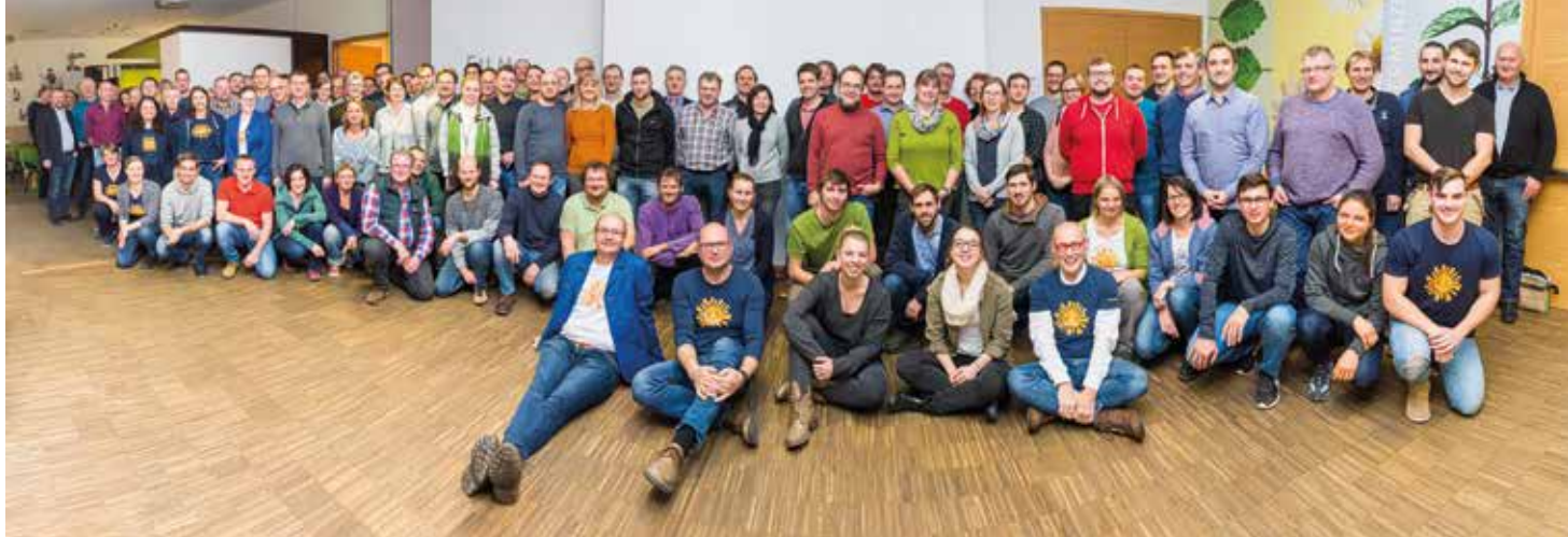
Jährliche Anbaubesprechung mit Bio-Landwirt*innen im Kräuterdorf in Sprögnitz.