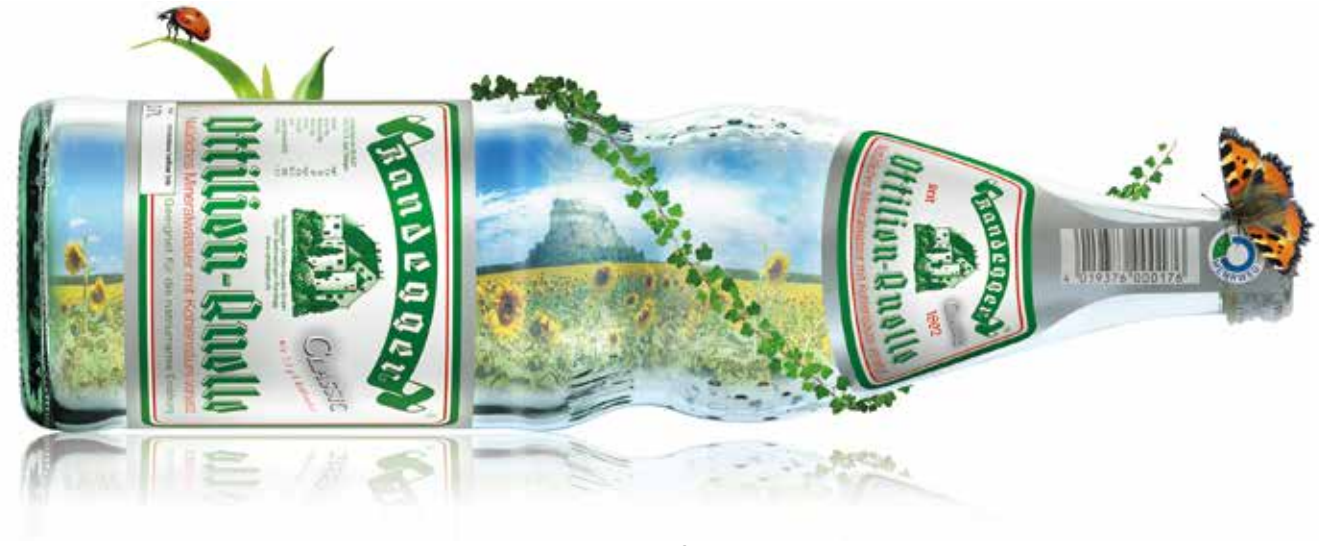
Perlenflasche: Kooperativ entwickelt – über 50 Jahre am Markt

Verbraucher*innen waren an der Entwicklung beteiligt. Schließlich wurde die bekannte Flaschenform mit schlanker Taille und 230 Perlchen, die sich um ihren Bauch verteilen, gewählt.