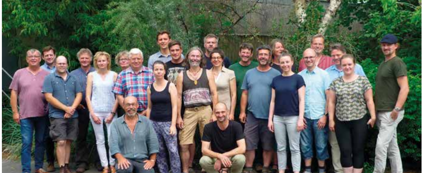
Runder Tisch Getreide 2019

wirtschaft noch die der Bäckereien widerspiegeln. Die vereinbarten Festpreise für Roggen, Weizen und Dinkel sollen den Höfen ein faires Einkommen sichern und gleichzeitig angemessene Rohstoffpreise für die Bäckereien darstellen, um es vielen Menschen zu ermöglichen, qualitativ hochwertiges Brot zu kaufen. Seitdem legen die Landwirt*innen am 'Runden Tisch Getreide' die Preise gemeinsam fest. Passt die Vereinbarung für eine*n Geschäftspartner*in im Laufe des Jahres nicht mehr, so wird die Runde einberufen und es wird neu verhandelt. Auch wenn aufgrund von externen Faktoren (z.B. Ernteauffällen) bestehende Zusagen nicht eingehalten werden können, wird gemeinsam nachverhandelt. Eine gute und verbindliche Zusammenarbeit steht im Mittelpunkt der Beziehungen, nicht der schnelle Euro für die eine oder andere Seite. Wie in den fair & regional-Kriterien des Märkischen Wirtschaftsbundes vorgesehen, stimmen die Landwirt*innen zum Abschluss des 'Runden Tisches Getreide' anonym darüber ab, ob die gemeinsamen Handelsbeziehungen als fair bewertet werden und Märkisches