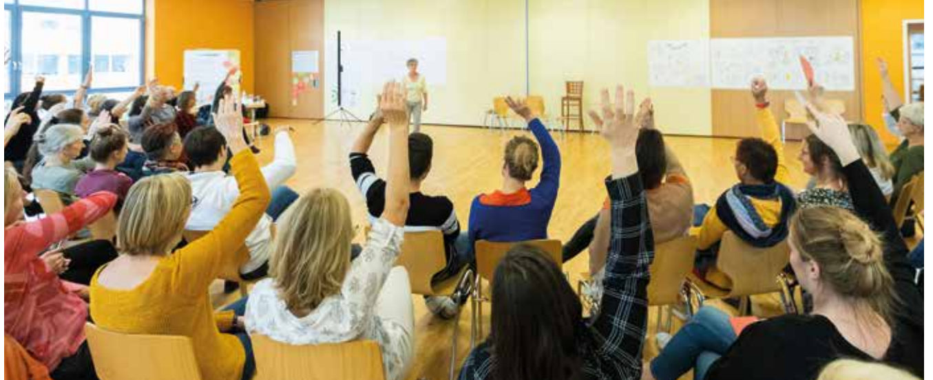
Die Mitarbeitenden sind beteiligt an Erfolg, Kapital und Entscheidungen.

die von Mitarbeitenden geführte bioverlag-Stiftung einspringen. Außer des monatlichen Bruttogehalts erhalten Mitarbeitende eine Erfolgsbeteiligung, welche gemeinsam auf Basis des Jahresabschlusses vereinbart wird. Diese wird im Verhältnis zur geleisteten Arbeitszeit ausgezahlt, was sich nivellierend auf das Gehaltsniveau auswirkt. Aktuell ist das höchste Gehalt im Verlag knapp dreimal so hoch wie das niedrigste. Die Mitarbeitenden haben für sich 35 Stunden als volle Wochenarbeitszeit definiert, u.a. um mehr Menschen beschäftigen zu können, und sie möchten sich selbst eine flexible Wochenarbeitszeit ermöglichen. Um dieses Ziel mit den gemeinschaftlichen und geschäftlichen Bedarfen in Einklang zu bringen, hat sich eine differenzierte Praxis zur Arbeitszeitorganisation entwickelt: Grundsätzlich können alle Mitarbeitenden unter Berücksichtigung der Arbeitserfordernisse in Abstimmung mit der Geschäftsleitung und den direkten Kolleg*innen ihre Arbeitszeit flexibel und ohne Kernzeit selbst organisieren. Für die notwendige Abstimmung in den Teams gibt es kein formelles