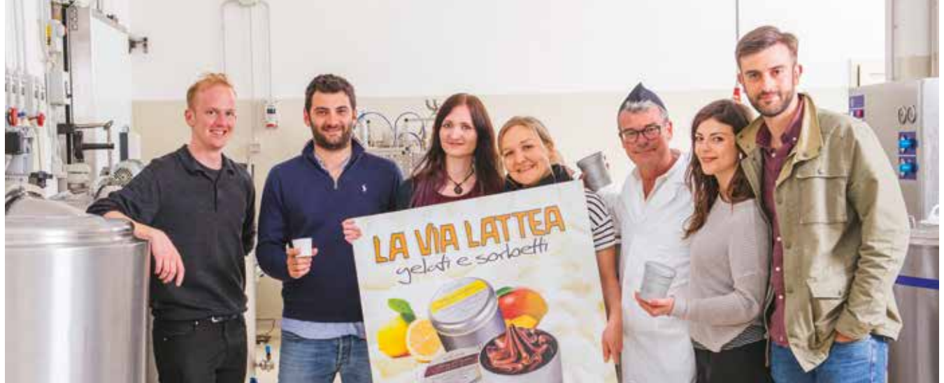
Im Rahmen der Transparenz-Initiative besuchen zwei Mitarbeiter*innen von Ökofrost die Speiseeisproduzentin La Via Lattea