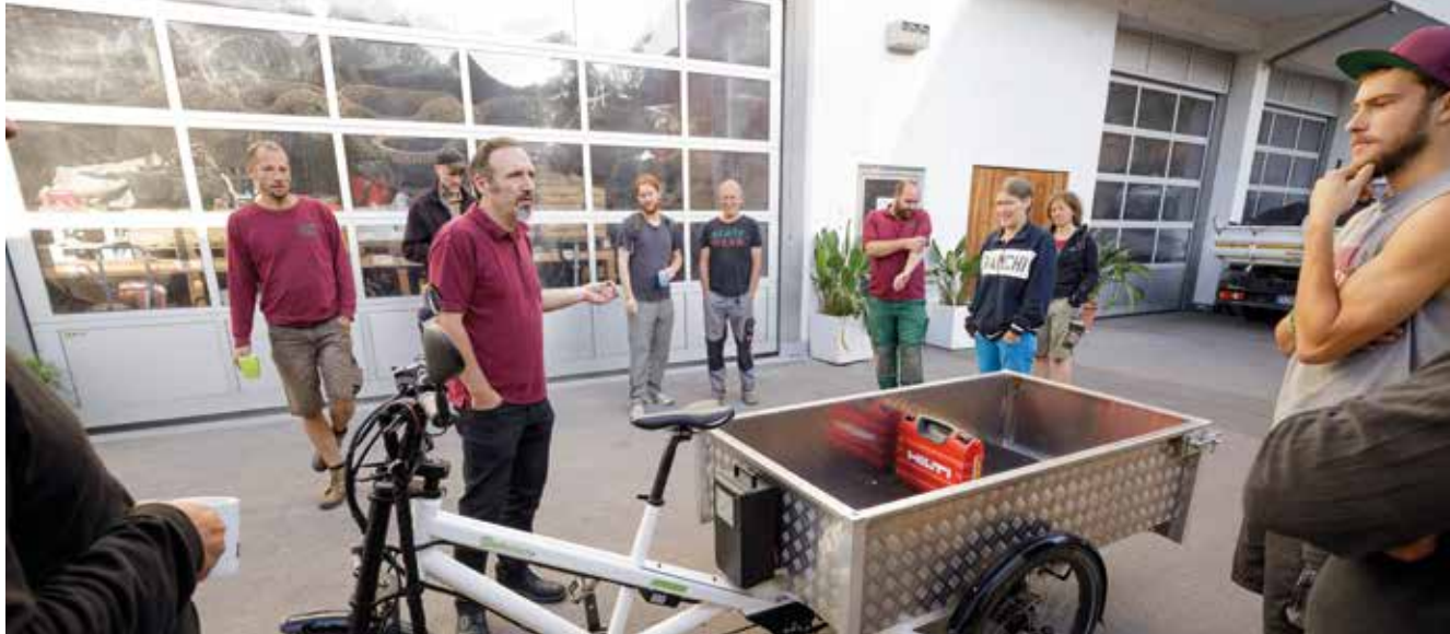
Betriebsentscheidungen im Konsens

getroffen! Wenn nötig, lassen sich die Beteiligten Zeit, um Einwände ernst zu nehmen und als Chance im Ringen um die beste Entscheidung zu verstehen. Die wichtigen Themen des laufenden Betriebes werden in der monatlichen Leiter*innenversammlung (Abteilungsleiter*innen, Geschäftsführung und Ausbilder*in) besprochen und entschieden. Zwar sind viele Verantwortungsträger*innen auch Gesellschafter*innen; offene Stellen im Betrieb, auch Führungspositionen, werden jedoch unabhängig davon besetzt, ob jemand Gesellschafter*in ist. Alle wichtigen Positionen im Betrieb sind mit Doppelspitzen besetzt. Das bewahrt davor, einseitige Entscheidungen zu treffen, die gegebenenfalls nicht angemessen sind. Zudem lässt sich hierüber besser austarieren, wer eher mitarbeitenden- und wer eher kund*innenorientiert denkt. Macht ist bei Blattwerk kein Selbstzweck, sondern Dienst an der Gemeinschaft und soll auf möglichst viele Schultern verteilt werden. Zusätzlich zu den Zusammenkünften der Gesellschafter*innen und Leiter*innen gibt es noch ein bis zwei Abteilungs-