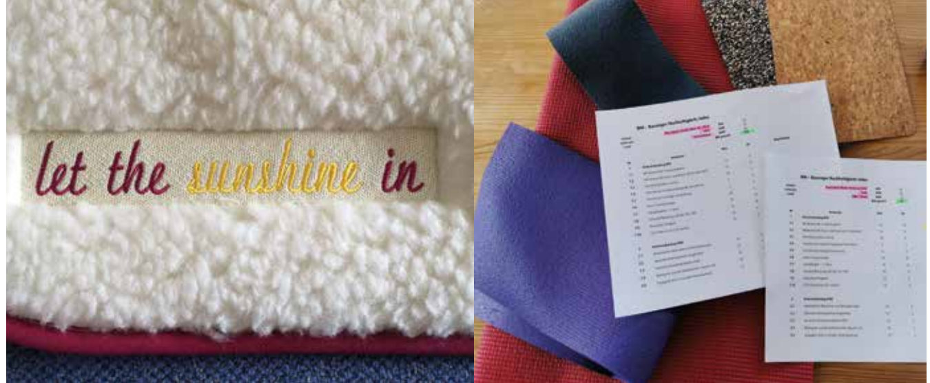
Bewertung nach Bausinger-Nachhaltigkeits-Index (BNI) © Bausinger

schuks dieser Erde in Monokulturen auf Kautschukplantagen in Malaysia und Indonesien hergestellt werden, mit einem hohen Einsatz an Insektiziden und Pestiziden, Degradierung der Böden und überdurchschnittlich hoher Erosion während des Monsunregens. Viele Plantagenarbeiter*innen haben gesundheitliche Probleme durch eingesetzte Spritzmittel. Bei der Vulkanisierung von Kautschuk entstehen Nitrosamine, die im Verdacht stehen, krebserregend zu sein. Hinzu kommt, dass Naturlatex unter UV-Einstrahlung leicht zerbröseln. Mit Zugaben von Acrylaten und Weichmachern wird die Lebens- und Nutzungsdauer verlängert, allerdings düstert der Weichmacher mit der Zeit aus (daher der typisch säuerliche Geruch von Naturgummi-Produkten). So enthalten nach Bausingers Recherchen Naturkautschukmatten etwa dreißig Prozent Acrylate und Weichmacher sowie ein Glasfasergewebe (PES-Gewebe). Die Verarbeitung erfolgt vor allem in China und in Taiwan. Alleine die