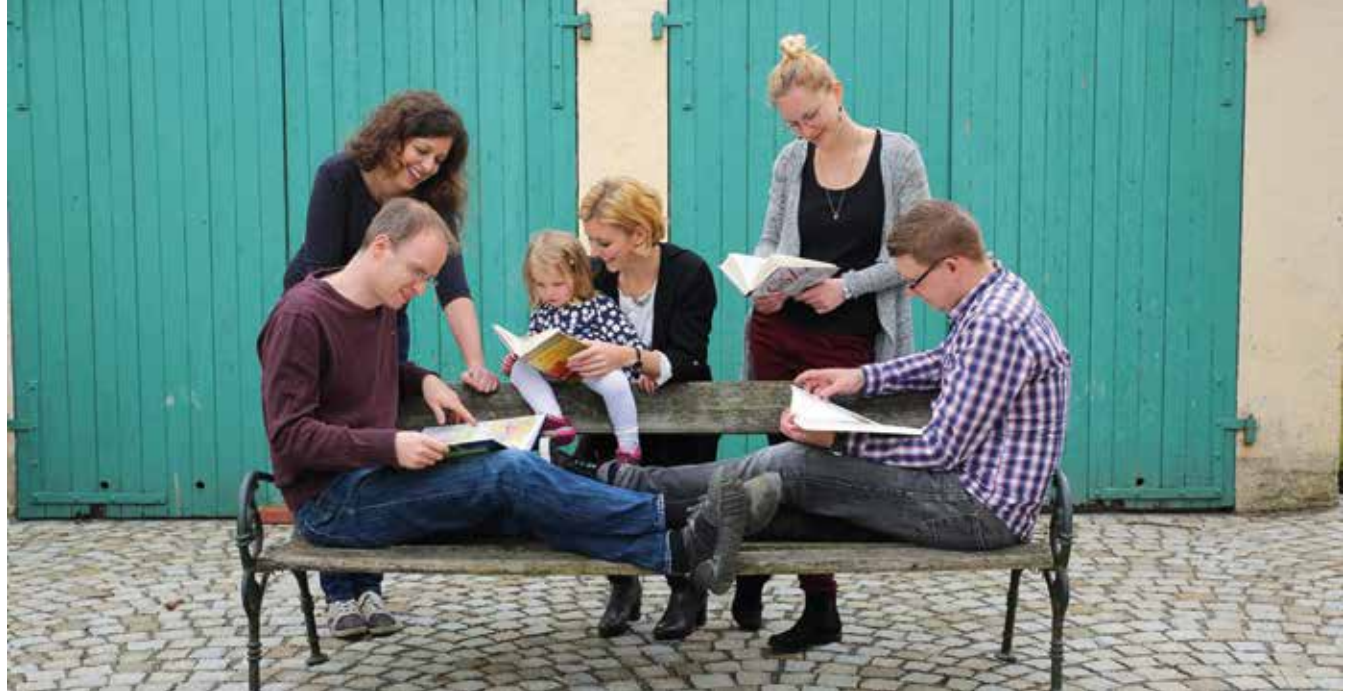
Hobby, Arbeit und Familie zusammen – das Buch7-Team

können auch kleine Vereine oder Gruppen unterstützt werden, die andere Fördermittel, wegen bürokratischer Hürden, nicht in Anspruch nehmen können. Beispiele geförderter Projekte: Das Inselhaus – Kinder- und Jugendhilfe in Eurasburg – hilft Kindern, die benachteiligt und durch familiäre Umstände in ihrer Entwicklung beeinträchtigt sind; foodwatch, die Lebensmittelskandale aufdecken; in Langweid, dem Firmensitz des Unternehmens, wurde der alte Bahnhof renoviert und ein gemeinnütziges Kulturzentrum gegründet. 2013 stieg der Umsatz auf 125.000 Euro, so dass der erste Gründer festangestellt werden konnte. Heute ist buch7 ein Unternehmen mit 14 Mitarbeitenden, über drei Millionen Euro Umsatz und einer kumulierten Spendenleistung von über 600.000 Euro, das entspricht etwa 75 Prozent des Gewinns. Trotz dieses Wachstums lebt das Team von buch7 weiterhin seinen idealistischen Traum, Spenden für wertvolle Projekte sozusagen aus dem „Nichts“ zu