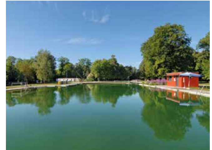
Im Naturbad Maria-Einsiedel wird das Badewasser im separat angelegten Regenerationsteich auf rein biologische und mechanische Weise gereinigt. Als sauberes, weiches Wasser fließt das Badewasser zurück in den Schwimm- und Kinderteich.

zu berücksichtigen. „Zu Anfang mussten wir uns die fundamentale Frage stellen, welche Umweltauswirkungen haben wir überhaupt, was geht rein und was geht wieder raus?“ Mit diesem Überblick wurden Potenziale zur Reduzierung ermittelt. Daraus leitet die Geschäftsführung die strategischen Mehrjahresziele ab. Jede der 18 Einrichtungen der Münchner Bäder übersetzt diese in eigene jährliche messbare Einzelziele und Maßnahmen , beispielsweise „Duschwasser pro Badegast ermitteln und reduzieren“, „Elektromotoren analysieren“ oder „Badewasserverbrauch auf 35 Liter je Badegast halten oder reduzieren“. Die kontinuierliche Fortschreibung der Ziele sowie das Kennzahlenmonitoring beeinflussen Entscheidungen über Sanierungen, Anlagenoptimierungen, Reparaturen aber auch Änderungen im Betriebsablauf und der Organisation. Zum Beispiel wurden die Verfahren der Wasserreinigung über Jahre optimiert. Schlechtwetterregeln wurden angepasst, um den Saisonstart, die