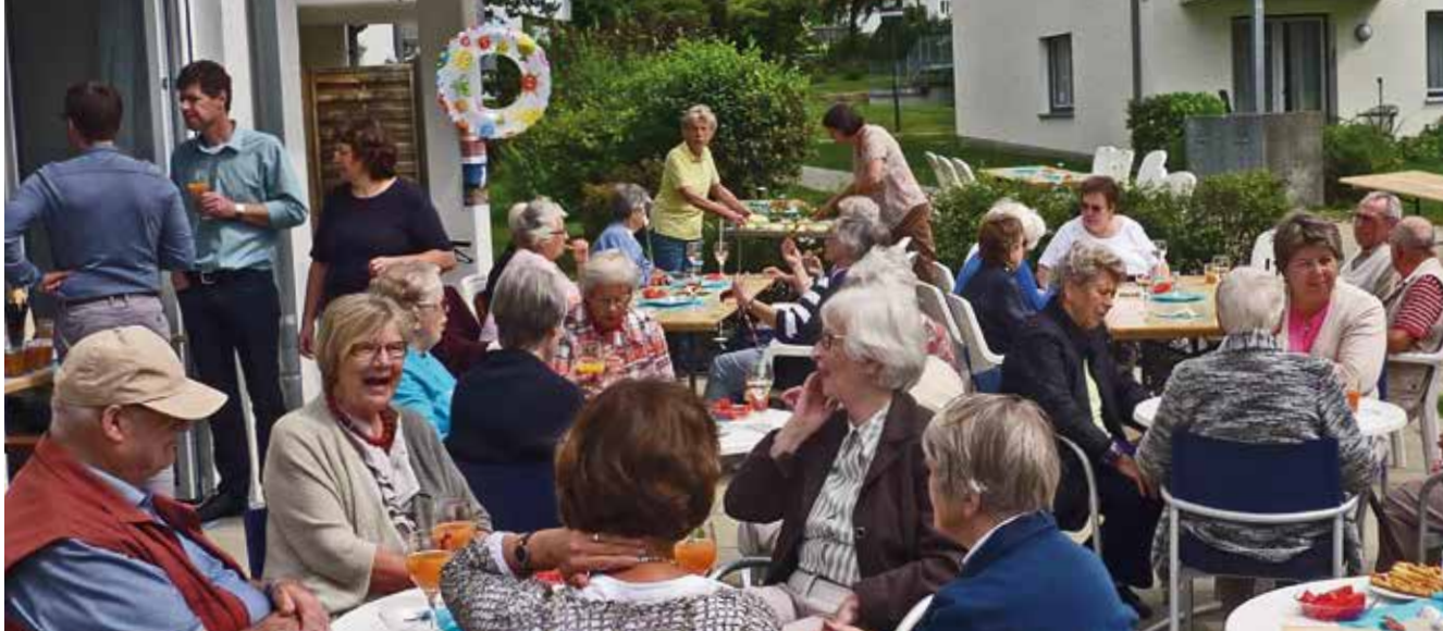
Inklusion im Stadtteil

des christlichen Glaubens, sondern öffnet ihre Angebote grundsätzlich für alle. Durch ihre Art Alten- und Eingliederungshilfe zu leben, setzt sich die Samariterstiftung für eine Aufwertung der dort geleisteten Arbeit ein, sowohl innerhalb der Stiftung als auch in der Gesellschaft. In der direkten Beratung von Klient*innen stehen Selbstwertgefühl und Teilhabe am gemeinsamen Leben im Mittelpunkt. So ist etwa die Arbeit der Tageskliniken für Psychiatrie und Psychotherapie darauf ausgerichtet, Menschen mit psychischen Erkrankungen und Krisen dabei zu unterstützen, diese zu bewältigen und trotz der Erschwernis ein gutes Leben in Gemeinschaft und in Verbundenheit zu führen. Durch Bildungsarbeit bemüht sich die Stiftung des weiteren um die gesellschaftliche Entstigmatisierung psychischer Krisen und Erkrankungen. Sie begegnet Klient*innen in ihrer besonderen Situation respektvoll und mit Wertschätzung und stößt so auch notwendige gesellschaftliche Veränderungsprozesse mit an. Die Stiftung verfolgt mit hoher Priorität an allen Standorten die aktive Integration und