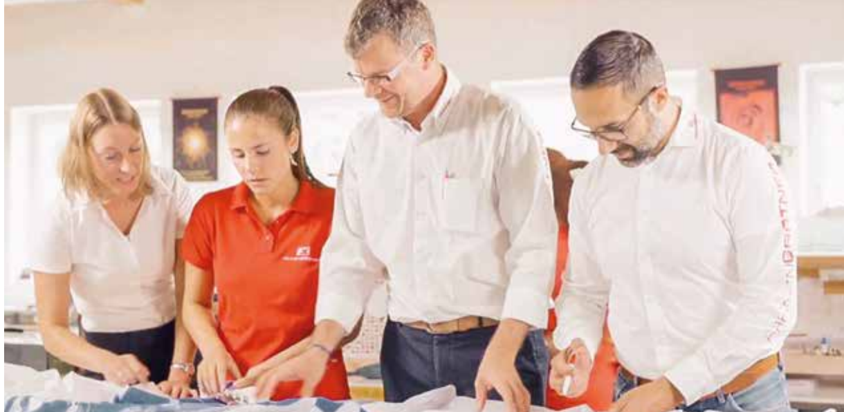
FAHNENGÄRTNER-Team bei der gemeinsamen Arbeit.

Befragungen der Belegschaft und Möglichkeiten der Mitwirkung ein. Ideen und Verbesserungsvorschläge der Mitarbeitenden werden gemeinsam auf Tauglichkeit geprüft und entsprechend umgesetzt. Vielfalt und Toleranz gelten dabei als wertvolle Quellen für erfolgreiche Teamarbeit. Auch auf Chancengleichheit legt das Unternehmen großen Wert. So sind jeweils 50 Prozent der Führungspositionen von Frauen und Männern besetzt. Eine weitere wichtige Säule der Unternehmenskultur besteht im mehrfach ausgezeichneten Gesundheitsprogramm 'XUNDI'. Entstanden ist dieses vor etwa zehn Jahren auf Initiative von Mitarbeitenden. Die Idee war es zunächst, für jeden mit dem Fahrrad zurückgelegten Kilometer des Arbeitswegs zehn Cent in einen Firmenfonds mit sozialem Zweck einzuzahlen. Mit beachtlichem Erfolg: Immer mehr Mitarbeitende beteiligten sich und verbanden so ein Mehr an körperlicher Bewegung mit einer ökologischeren Anfahrt sowie der Förderung eines sinnstiftenden Zwecks. Relativ schnell entwickelte sich aus dieser Initiative ein breites Pro-