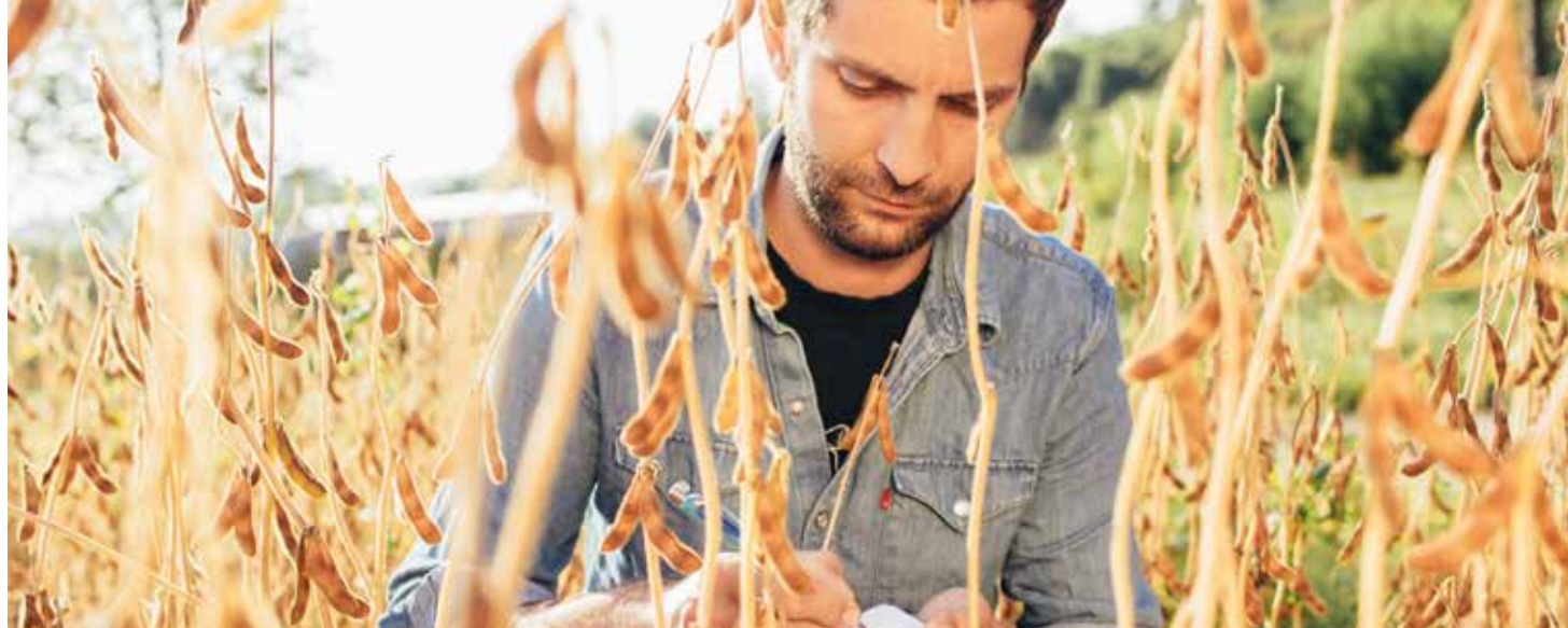
Neue Soja-Sorten können vielfältige Anbaugelände erschließen.

Verfügung. In der jährlichen 'Sojarunde' erhalten die Landwirt*innen außerdem durch die Geschäftsführung aus erster Hand Einblicke in das Geschehen auf den wichtigsten Märkten, in Investitionen und Herausforderungen. Hierbei gibt es auch Gelegenheit zum Austausch über die Herausforderungen des vergangenen und kommenden Anbaujahrs und über die Entwicklung des Sojapreises. Dieser wird von Taifun fair und angemessen gestaltet und den Vertragspartner*innen transparent mitgeteilt – bereits vor der Aussaat. Bei entsprechender Qualität übernimmt Taifun die gesamte Menge der vorher vereinbarten Fläche. Das bietet den Landwirten wirtschaftliche Sicherheit. Eine maßgebliche Innovation im Sojaanbau hat Taifun durch Sortenentwicklung mitinitiiert: Sojabohnen zur Tofu-Herstellung wurden in Europa vorwiegend entlang des 48. Breitengrades erfolgreich angebaut, in Deutschland vor allem in Baden und der Pfalz. Für andere Regionen gab es bisher keine passenden Sorten. Auf der Suche nach Sojabohnen,