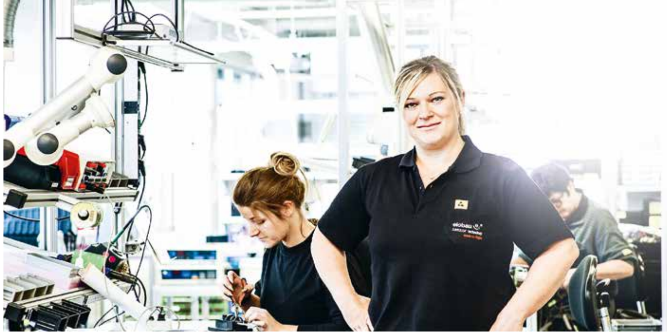
elobau verzichtet bewusst auf alle gefährlichen und giftigen Stoffe in seinen Produkten

Werkstoffe und Konstruktionsmethoden untersucht und eingesetzt, die die ökologische Nachhaltigkeit der Produkte verbessern. Im hauseigenen Prüflabor können Umwelteinflüsse simuliert werden und so eine möglichst lange Lebensdauer der Produkte (20.000 Betriebsstunden, das entspricht einer Lebensdauer von etwa zehn Jahren) gewährleistet und dadurch schädliche Umweltauswirkungen reduziert werden. elobau verzichtet bewusst auf alle gefährlichen und giftigen Stoffe in seinen Produkten und achtet konstant darauf, ob weitere Materialien als problematisch (nach Reach oder RoHS) eingestuft werden. Die Basistechnologie 'Reed in Sensoren' ist per se langlebig, da sie ohne Versorgungsspannung auskommt und daher als sehr energieeffizient zu bewerten ist. Eine modulare Bauweise sowie eine Trennbarkeit der Teile gewährleisten Reparaturfreundlichkeit bzw. eine Wiederverwertung nach Sorten. Vor allem Teile mit hohem Verschleiß werden so entwickelt, dass sie austauschbar sind. Produkte werden in der Regel