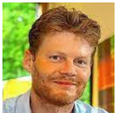
Armin Steuernagel Stiftung Verantwortungseigentum

„Wirtschaftliche Aktivitäten sollten prinzipiell auf das Gemeinwohl ausgerichtet werden, und der rechtliche Anreizrahmen alle Akteur*innen dafür belohnen.“