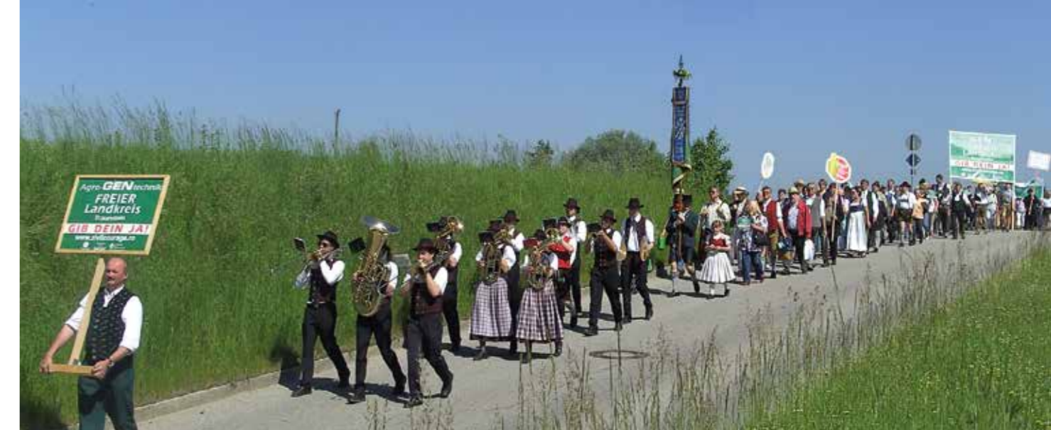
Demonstrationszug der Initiative Zivilcourage gegen Gentechnik, 2008, Rosenheim

die einzig sinnvolle Maßnahme zu sein. Allen waren nur die angeblichen Vorteile von Agro-Gentechnik bekannt gemacht worden. Über die unweigerlich folgende Abhängigkeit von den Großkonzernen, die Auswirkungen für die Landwirt*innen in den ärmeren Regionen der Welt, die steigenden Einsatzmengen von Pflanzenschutzmitteln und die unabsehbaren Risiken einer Freisetzung von gentechnisch veränderten Organismen waren sie bewusst getäuscht worden. EM-Chiemgau baute eine Kampagnen-Website mit Detailinformationen zu den Hintergründen von Agro-Gentechnik auf, die bald zur Referenz wurde. Über 30.000 Menschen hinterließen namentlich im Internet ein Statement zur Agro-Gen Technik, damals eine unglaublich hohe Zahl!