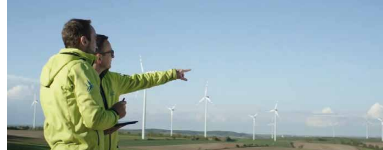
1998 startete die Windkraft Simonsfeld AG mit zwei Windkraftanlagen. Heute erzeugen 90 Windkraftanlagen und ein Sonnenkraftwerk eine Strommenge, die dem Jahresverbrauch von 166.000 Haushalten entspricht.

Bulgarien und der Slowakei. Das Energieunternehmen gestaltet seit über 20 Jahren die Energiewende in Österreich mit. Es beschäftigt heute mehr als 100 Mitarbeitende in fünf Ländern. Mit rund 3.700 Beteiligten ist die Windkraft Simonsfeld AG eine der großen Bürger*innen-Beteiligungsunternehmen Österreichs. Mehr als die Hälfte der Beteiligten sind in Niederösterreich zuhause. Ganze 45 Prozent des Grundkapitals sind im Eigentum von Menschen, die im niederösterreichischen Weinviertel, also nur unweit der heimischen Windparks leben. Das Stimmrecht ist laut Satzung mit fünf Prozent der Anteile begrenzt und sichert so ein demokratisches Mitbestimmungsrecht. Insgesamt hält aktuell niemand mehr als sechs Prozent der Anteile an der Windkraft Simonsfeld AG. Die Investitionen des Energieproduzenten dienen allein dem Ausbau erneuerbarer Energie, also der Erhöhung des erneuerbaren Energieanteils im österreichischen Strommix. Die Windkraft Simonsfeld AG sieht ihre Hauptaufgabe in der Bereitstellung von sauberem Strom aus erneuerbaren Energien zur Erreichung der Klimaziele. Die hohe technische Ver-