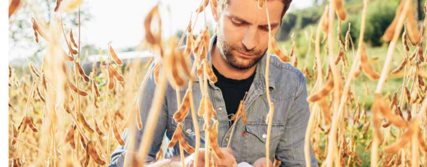
Neue Soja-Sorten können vielfältige Anbauggebiete erschließen.

Verfügung. In der jährlichen 'Sojarunde' erhalten die Landwirt*innen außerdem durch die Geschäftsführung aus erster Hand Einblicke in das Geschehen auf den wichtigsten Märkten, in Investitionen und Herausforderungen. Hierbei gibt es auch Gelegenheit zum Austausch über die Herausforderungen des vergangenen und kommenden Anbaujahrs und über die Entwicklung des Sojapreises. Dieser wird von Taifun fair und angemessen gestaltet und den Vertragspartner*innen transparent mitgeteilt – bereits vor der Aussaat. Bei entsprechender Qualität übernimmt Taifun die gesamte Menge der vorher vereinbarten Fläche. Das bietet den Landwirten wirtschaftliche Sicherheit. Eine maßgebliche Innovation im Sojaanbau hat Taifun durch Sortenentwicklung mitinitiiert: Sojabohnen zur Tofu-Herstellung wurden in Europa vorwiegend entlang des 48. Breitengrades erfolgreich angebaut, in Deutschland vor allem in Baden und der Pfalz. Für andere Regionen gab es bisher keine passenden Sorten. Auf der Suche nach Sojabohnen,