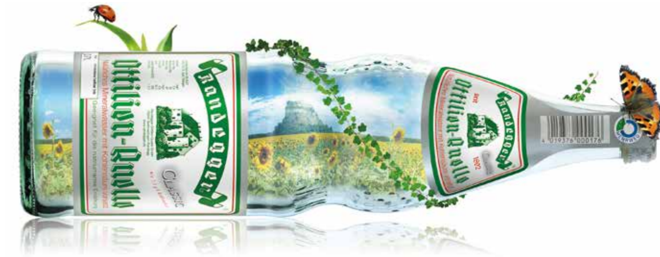
Perlenflasche: Kooperativ entwickelt – über 50 Jahre am Markt

Die Perlenflasche erhielt 2019 den 'German Design Award' in Gold, den renommiertesten Designerpreis Deutschlands: Ein Aufruf zur Trendumkehr nicht nur an die restlichen Getränkeproduzent*innen, sondern auch an produzierende Unternehmen in anderen