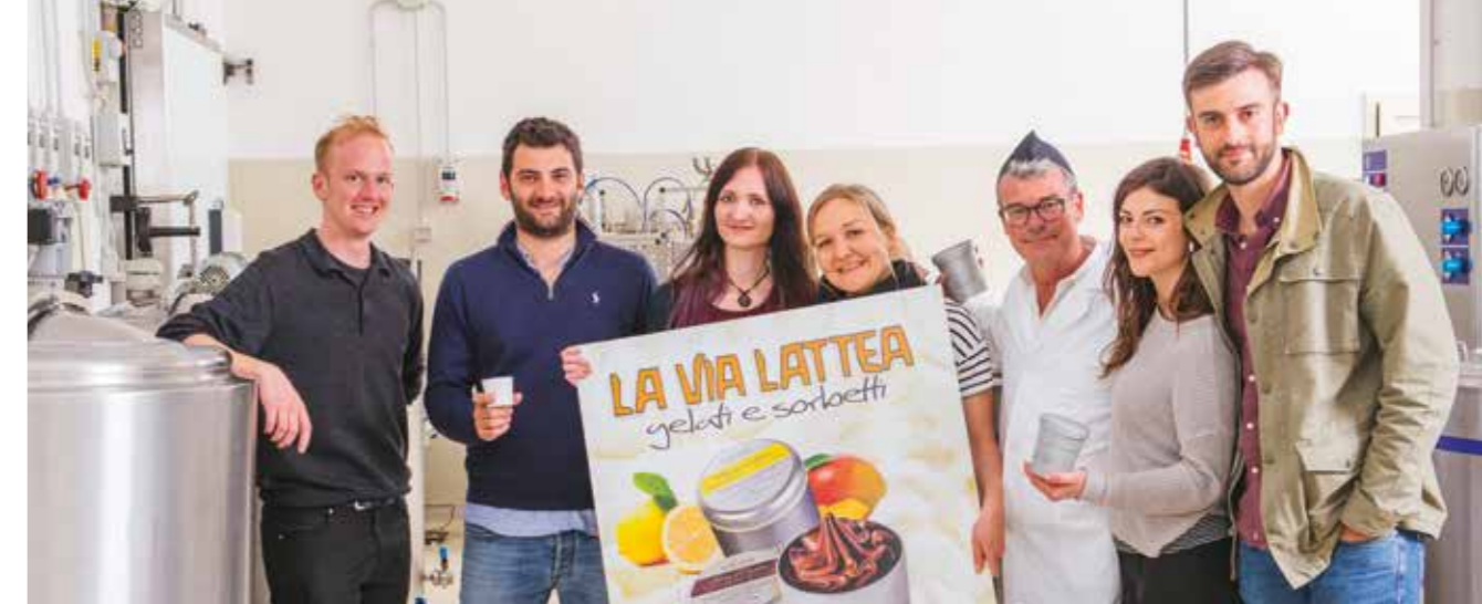
Im Rahmen der Transparenz-Initiative besuchen zwei Mitarbeiter*innen von Ökofrost die Speiseeisproduzentin La Via Lattea