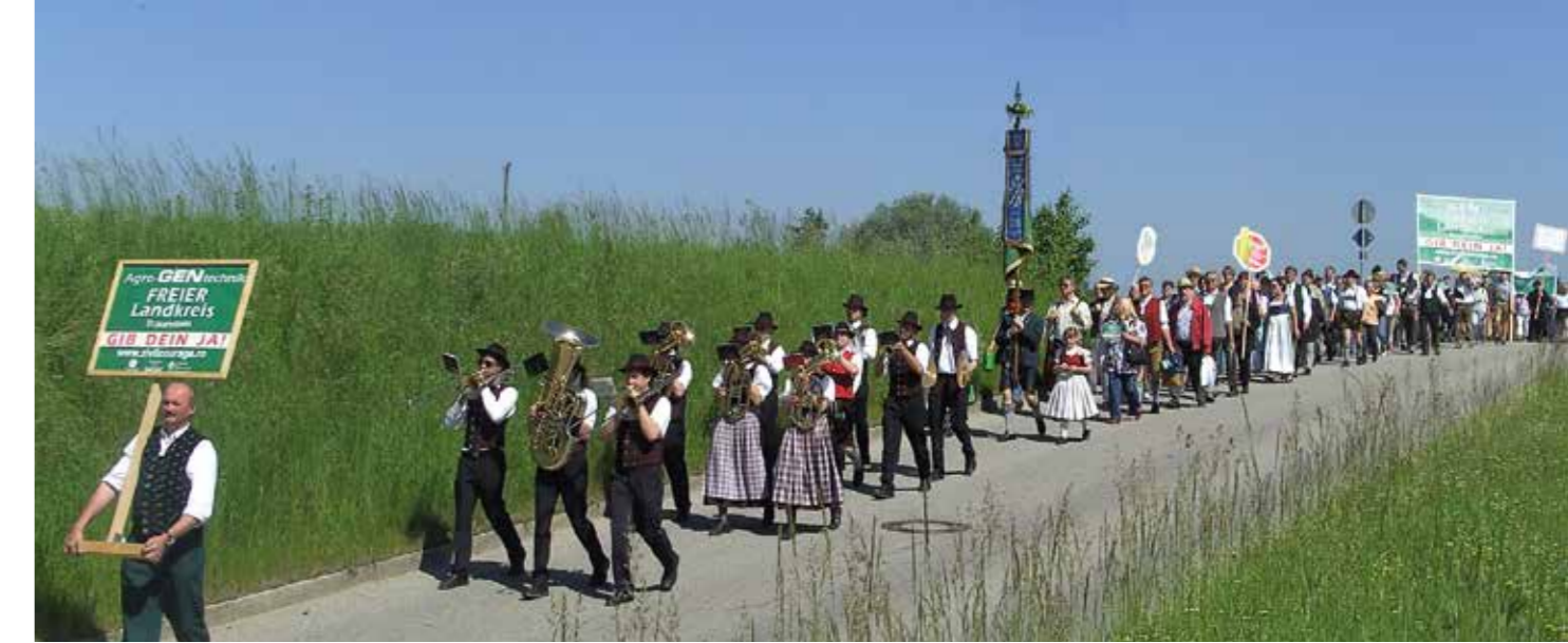
Demonstrationszug der Initiative Zivilcourage gegen Gentechnik, 2008, Rosenheim

die einzig sinnvolle Maßnahme zu sein. Allen waren nur die angeblichen Vorteile von Agro-Gentechnik bekannt gemacht worden. Über die unweigerlich folgende Abhängigkeit von den Großkonzernen, die Auswirkungen für die Landwirt*innen in den ärmeren Regionen der Welt, die steigenden Einsatzmengen von Pflanzenschutzmitteln und die unabsehbaren Risiken einer Freisetzung von gentechnisch veränderten Organismen waren sie bewusst getäuscht worden. EM-Chiemgau baute eine Kampagnen-Website mit Detailinformationen zu den Hintergründen von Agro-Gentechnik auf, die bald zur Referenz wurde. Über 30.000 Menschen hinterließen namentlich im Internet ein Statement zur Agro-Gen Technik, damals eine unglaublich hohe Zahl!