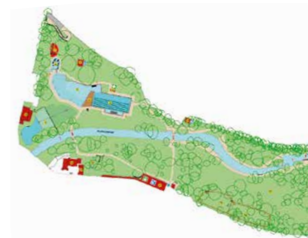
Im Naturbad Maria-Einsiedel wird das Badewasser im separat angelegten Regenerationsteich auf rein biologische und mechanische Weise gereinigt. Als sauberes, weiches Wasser fließt das Badewasser zurück in den Schwimm- und Kinderteich.

Branche: Kommunalbetrieb Mitarbeitende: 283 inkl. Saisonkräfte (VZÄ) Ort: München (DE) www.swm.de/baeder