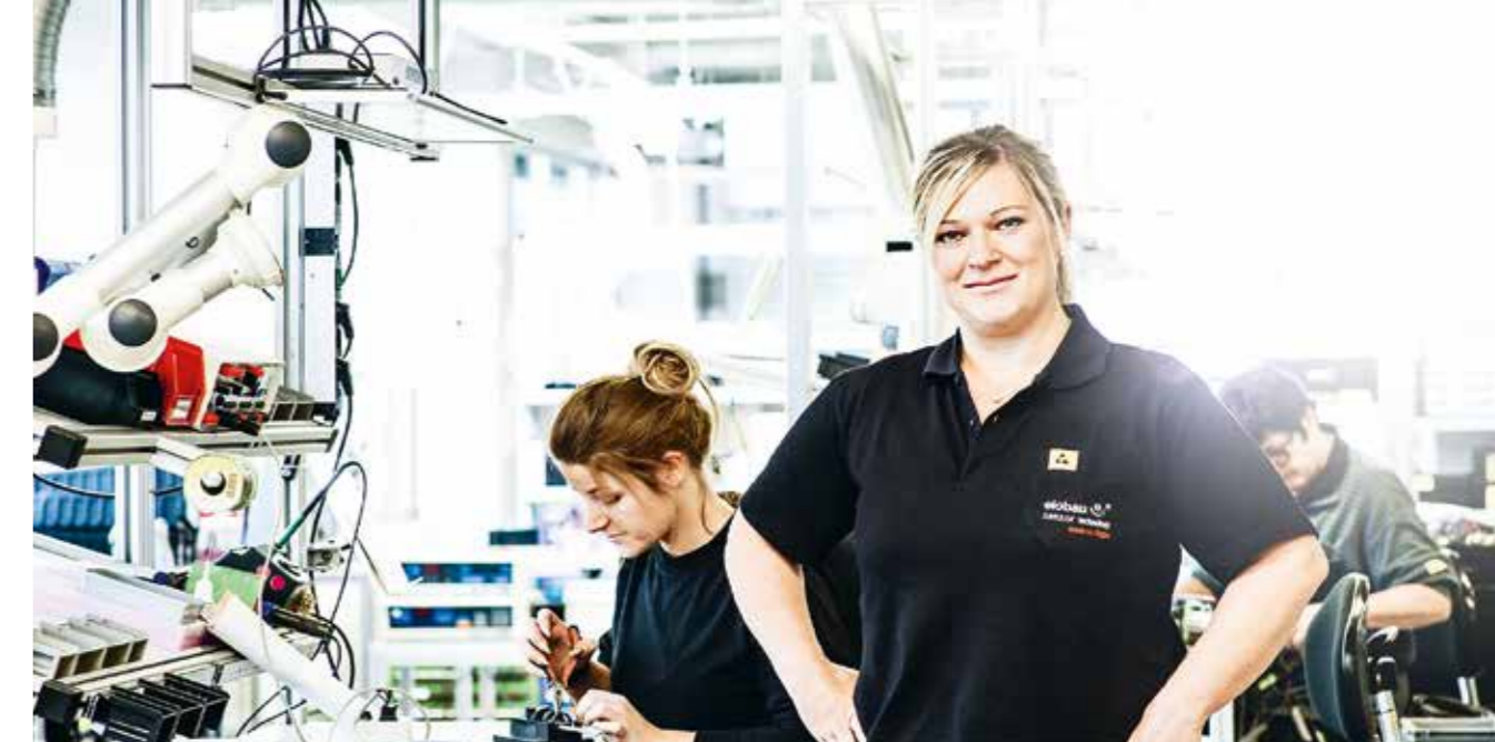
elobau verzichtet bewusst auf alle gefährlichen und giftigen Stoffe in seinen Produkten

Werkstoffe und Konstruktionsmethoden untersucht und eingesetzt, die die ökologische Nachhaltigkeit der Produkte verbessern. Im hauseigenen Prüflabor können Umwelteinflüsse simuliert werden und so eine möglichst lange Lebensdauer der Produkte (20.000 Betriebsstunden, das entspricht einer Lebensdauer von etwa zehn Jahren) gewährleistet und dadurch schädliche Umweltauswirkungen reduziert werden. elobau verzichtet bewusst auf alle gefährlichen und giftigen Stoffe in seinen Produkten und achtet konstant darauf, ob weitere Materialien als problematisch (nach Reach oder RoHS) eingestuft werden. Die Basistechnologie 'Reed in Sensoren' ist per se langlebig, da sie ohne Versorgungsspannung auskommt und daher als sehr energieeffizient zu bewerten ist. Eine modulare Bauweise sowie eine Trennbarkeit der Teile gewährleisten Reparaturfreundlichkeit bzw. eine Wiederverwertung nach Sorten. Vor allem Teile mit hohem Verschleiß werden so entwickelt, dass sie austauschbar sind. Produkte werden in der Regel