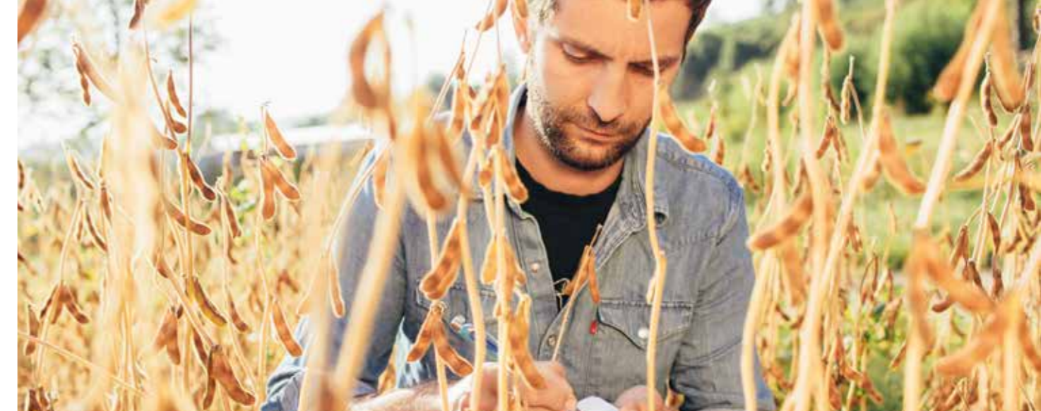
Neue Soja-Sorten können vielfältige Anbaugelände erschließen.

Verfügung. In der jährlichen 'Sojarunde' erhalten die Landwirt*innen außerdem durch die Geschäftsführung aus erster Hand Einblicke in das Geschehen auf den wichtigsten Märkten, in Investitionen und Herausforderungen. Hierbei gibt es auch Gelegenheit zum Austausch über die Herausforderungen des vergangenen und kommenden Anbaujahrs und über die Entwicklung des Sojapreises. Dieser wird von Taifun fair und angemessen gestaltet und den Vertragspartner*innen transparent mitgeteilt – bereits vor der Aussaat. Bei entsprechender Qualität übernimmt Taifun die gesamte Menge der vorher vereinbarten Fläche. Das bietet den Landwirten wirtschaftliche Sicherheit. Eine maßgebliche Innovation im Sojaanbau hat Taifun durch Sortenentwicklung mitinitiiert: Sojabohnen zur Tofu-Herstellung wurden in Europa vorwiegend entlang des 48. Breitengrades erfolgreich angebaut, in Deutschland vor allem in Baden und der Pfalz. Für andere Regionen gab es bisher keine passenden Sorten. Auf der Suche nach Sojabohnen,