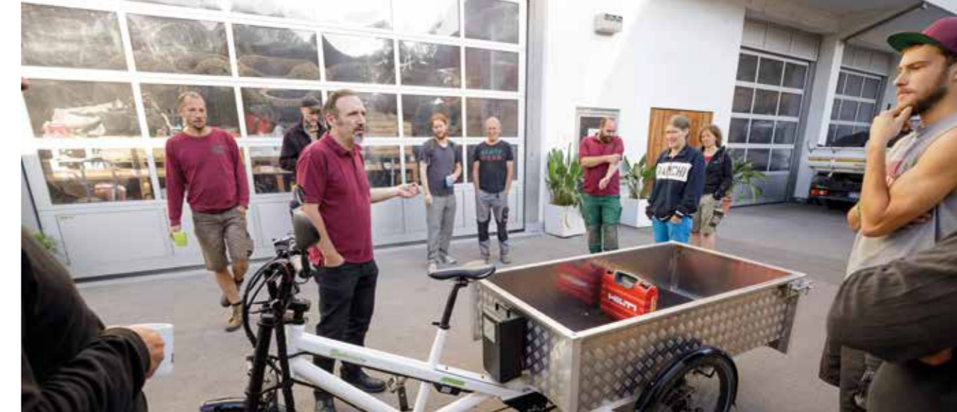
Betriebsentscheidungen im Konsens

getroffen! Wenn nötig, lassen sich die Beteiligten Zeit, um Einwände ernst zu nehmen und als Chance im Ringen um die beste Entscheidung zu verstehen. Die wichtigen Themen des laufenden Betriebes werden in der monatlichen Leiter*innenversammlung (Abteilungsleiter*innen, Geschäftsführung und Ausbilder*in) besprochen und entschieden. Zwar sind viele Verantwortungsträger*innen auch Gesellschafter*innen; offene Stellen im Betrieb, auch Führungspositionen, werden jedoch unabhängig davon besetzt, ob jemand Gesellschafter*in ist. Alle wichtigen Positionen im Betrieb sind mit Doppelspitzen besetzt. Das bewahrt davor, einseitige Entscheidungen zu treffen, die gegebenenfalls nicht angemessen sind. Zudem lässt sich hierüber besser austarieren, wer eher mitarbeitenden- und wer eher kund*innenorientiert denkt. Macht ist bei Blattwerk kein Selbstzweck, sondern Dienst an der Gemeinschaft und soll auf möglichst viele Schultern verteilt werden. Zusätzlich zu den Zusammenkünften der Gesellschafter*innen und Leiter*innen gibt es noch ein bis zwei Abteilungs-