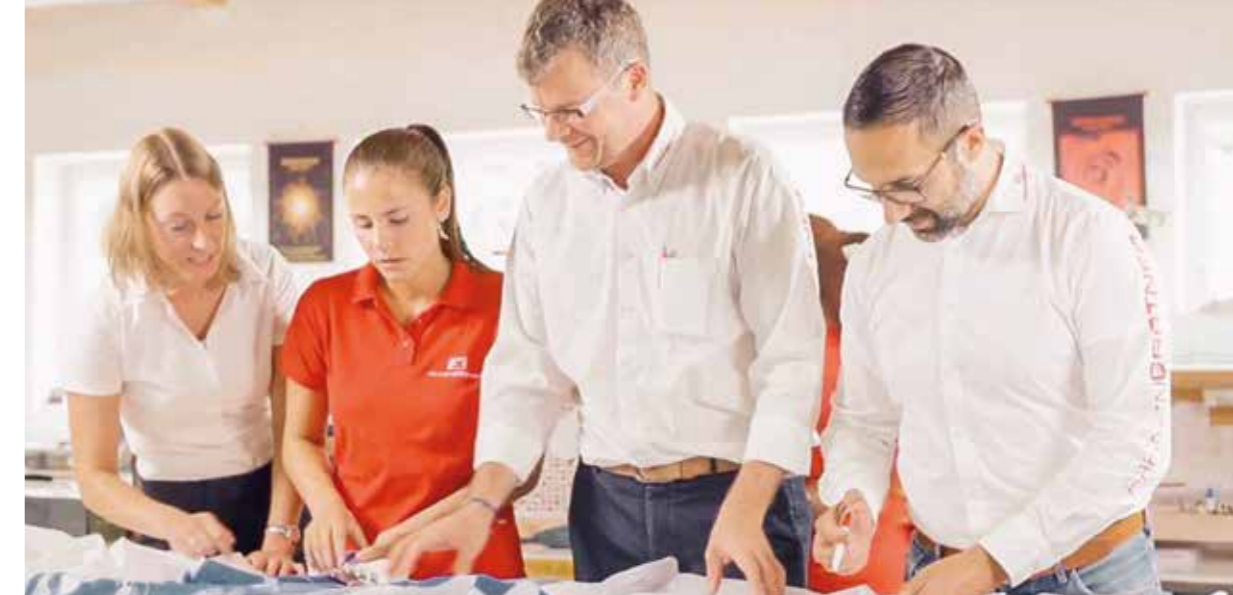
FAHNENGÄRTNER-Team bei der gemeinsamen Arbeit.

Befragungen der Belegschaft und Möglichkeiten der Mitwirkung ein. Ideen und Verbesserungsvorschläge der Mitarbeitenden werden gemeinsam auf Tauglichkeit geprüft und entsprechend umgesetzt. Vielfalt und Toleranz gelten dabei als wertvolle Quellen für erfolgreiche Teamarbeit. Auch auf Chancengleichheit legt das Unternehmen großen Wert. So sind jeweils 50 Prozent der Führungspositionen von Frauen und Männern besetzt. Eine weitere wichtige Säule der Unternehmenskultur besteht im mehrfach ausgezeichneten Gesundheitsprogramm 'XUNDI'. Entstanden ist dieses vor etwa zehn Jahren auf Initiative von Mitarbeitenden. Die Idee war es zunächst, für jeden mit dem Fahrrad zurückgelegten Kilometer des Arbeitswegs zehn Cent in einen Firmenfonds mit sozialem Zweck einzuzahlen. Mit beachtlichem Erfolg: Immer mehr Mitarbeitende beteiligten sich und verbanden so ein Mehr an körperlicher Bewegung mit einer ökologischeren Anfahrt sowie der Förderung eines sinnstiftenden Zwecks. Relativ schnell entwickelte sich aus dieser Initiative ein breites Pro-