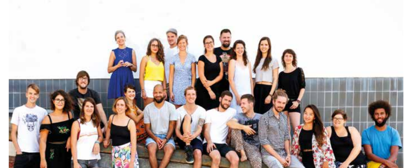
„Wir wollen uns als ganzer Mensch zeigen können, mit allem was so da ist, und trotzdem unsere Aufgaben wirklich ernst nehmen und Dinge massiv voranbringen.“

kräfte im klassischen Sinne. Alle Aufgabenbereiche sind in Rollen aufgeteilt. Rollen haben einen Zweck und mehrere Zuständigkeiten. Diese werden von der Person ausgefüllt, die aktuell am besten dafür geeignet scheint. Operative Entscheidungen liegen grundsätzlich dort. Entscheidungen, die Mitglieder kollektiv betreffen, wie etwa Budgets, das Lohnsystem, Einstellung und Entlassung von Kolleg*innen, betriebliche Innovationen, aber auch strategische Entscheidungen werden in strukturierten Meeting-Prozessen über die „integrative Entscheidungsmethode“ getroffen. Diese Methode erlaubt es allen, eine so genannte „Spannung“, die eine Lösung fordert, in den monatlich stattfindenden Governance-Prozess einzubringen. Spannungen können nicht per Veto oder Mehrheitsentscheid zum Verstummen gebracht, sondern müssen über Lösungsvorschläge und gegebenenfalls weitere Einwände integriert werden. Hier greift eine Moderation, die auf gleiche Rederechte und qualifizierte Einwände achtet. Denn jede/r muss sich mit Einwänden auf die