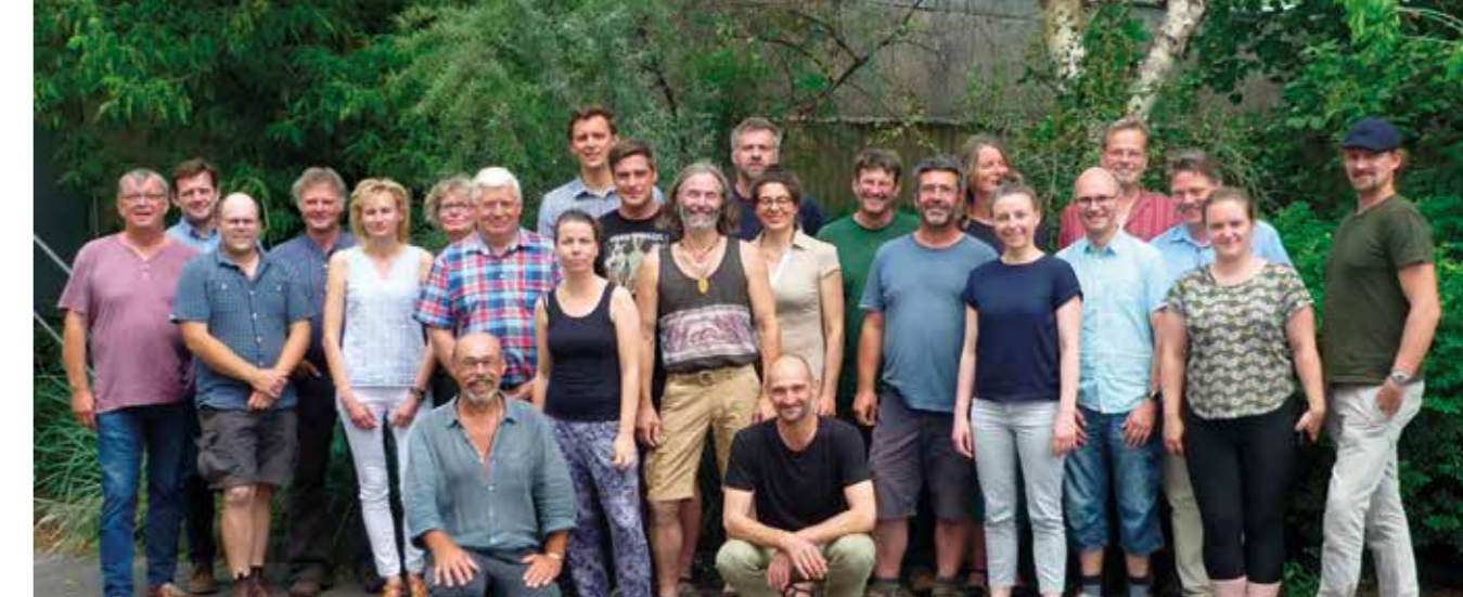
Runder Tisch Getreide 2019

wirtschaft noch die der Bäckereien widerspiegeln. Die vereinbarten Festpreise für Roggen, Weizen und Dinkel sollen den Höfen ein faires Einkommen sichern und gleichzeitig angemessene Rohstoffpreise für die Bäckereien darstellen, um es vielen Menschen zu ermöglichen, qualitativ hochwertiges Brot zu kaufen. Seitdem legen die Landwirt*innen am 'Runden Tisch Getreide' die Preise gemeinsam fest. Passt die Vereinbarung für eine*n Geschäftspartner*in im Laufe des Jahres nicht mehr, so wird die Runde einberufen und es wird neu verhandelt. Auch wenn aufgrund von externen Faktoren (z.B. Ernteauffällen) bestehende Zusagen nicht eingehalten werden können, wird gemeinsam nachverhandelt. Eine gute und verbindliche Zusammenarbeit steht im Mittelpunkt der Beziehungen, nicht der schnelle Euro für die eine oder andere Seite. Wie in den fair & regional-Kriterien des Märkischen Wirtschaftsverbundes vorgesehen, stimmen die Landwirt*innen zum Abschluss des 'Runden Tisches Getreide' anonym darüber ab, ob die gemeinsamen Handelsbeziehungen als fair bewertet werden und Märkisches