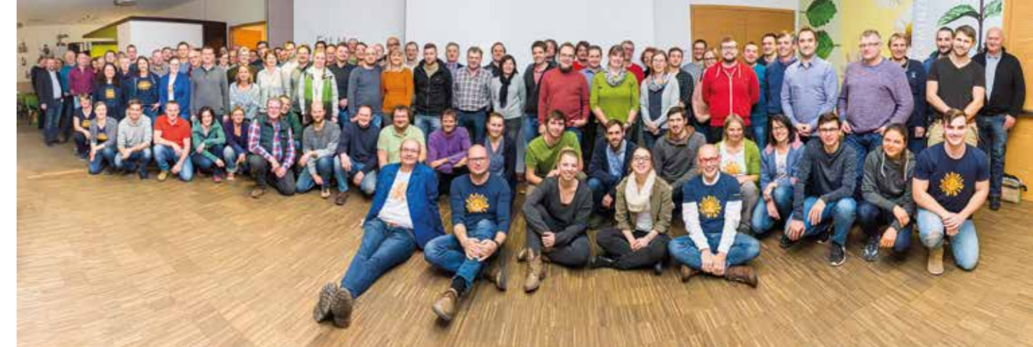
Jährliche Anbaubesprechung mit Bio-Landwirt*innen im Kräuterdorf in Sprögnitz.