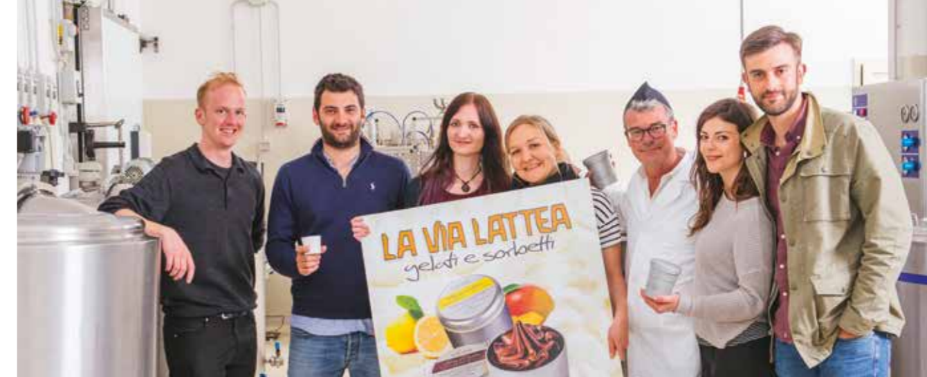
Im Rahmen der Transparenz-Initiative besuchen zwei Mitarbeiter*innen von Ökofrost die Speiseeisproduzentin La Via Lattea