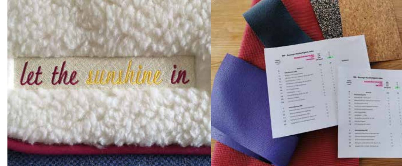
Bewertung nach Bausinger-Nachhaltigkeits-Index (BNI) © Bausinger

schuks dieser Erde in Monokulturen auf Kautschukplantagen in Malaysia und Indonesien hergestellt werden, mit einem hohen Einsatz an Insektiziden und Pestiziden, Degradierung der Böden und überdurchschnittlich hoher Erosion während des Monsunregens. Viele Plantagenarbeiter*innen haben gesundheitliche Probleme durch eingesetzte Spritzmittel. Bei der Vulkanisierung von Kautschuk entstehen Nitrosamine, die im Verdacht stehen, krebserregend zu sein. Hinzu kommt, dass Naturlatex unter UV-Einstrahlung leicht zerbröseln. Mit Zugaben von Acrylaten und Weichmachern wird die Lebens- und Nutzungsdauer verlängert, allerdings dünstet der Weichmacher mit der Zeit aus (daher der typisch säuerliche Geruch von Naturgummi-Produkten). So enthalten nach Bausingers Recherchen Naturkautschukmatten etwa dreißig Prozent Acrylate und Weichmacher sowie ein Glasfasergewebe (PES-Gewebe). Die Verarbeitung erfolgt vor allem in China und in Taiwan. Alleine die