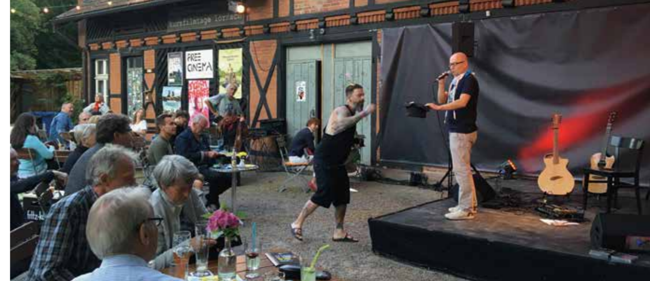
Soziokultureller Treffpunkt im Selbsteigentum

kleinen Bühne. In einem der zwei Nebengebäude befindet sich ein Theatersaal mit Foyer und Bar, der auch für mittelgroße Workshops, Vorträge, Musik- und Tanzveranstaltungen genutzt werden kann. Das andere Nebengebäude ist an das free cinema vermietet, dem einzigen von Jugendlichen in Eigenverantwortung, und ehrenamtlich, betriebenen Kino Deutschlands. Auf den Bühnen des Hauses liegen die Schwerpunkte bei Kabarett und Comedy, Musik (Singer-Songwriter, Folk, Weltmusik) und Amateur-Theater. Vorgestellt werden dabei nicht nur nationale und internationale Künstler*innen. Gerade auch regionale und Nachwuchs-Künstler*innen erhalten die Möglichkeit, ihre Arbeiten in einem professionellen Rahmen zu präsentieren. Das Kulturzentrum hat keine Gewinnabsicht, sondern strebt an, nachhaltig zum Wohle der