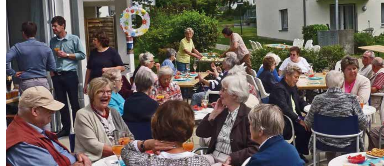
Inklusion im Stadtteil

des christlichen Glaubens, sondern öffnet ihre Angebote grundsätzlich für alle. Durch ihre Art Alten- und Eingliederungshilfe zu leben, setzt sich die Samariterstiftung für eine Aufwertung der dort geleisteten Arbeit ein, sowohl innerhalb der Stiftung als auch in der Gesellschaft. In der direkten Beratung von Klient*innen stehen Selbstwertgefühl und Teilhabe am gemeinsamen Leben im Mittelpunkt. So ist etwa die Arbeit der Tageskliniken für Psychiatrie und Psychotherapie darauf ausgerichtet, Menschen mit psychischen Erkrankungen und Krisen dabei zu unterstützen, diese zu bewältigen und trotz der Erschwernis ein gutes Leben in Gemeinschaft und in Verbundenheit zu führen. Durch Bildungsarbeit bemüht sich die Stiftung des weiteren um die gesellschaftliche Entstigmatisierung psychischer Krisen und Erkrankungen. Sie begegnet Klient*innen in ihrer besonderen Situation respektvoll und mit Wertschätzung und stößt so auch notwendige gesellschaftliche Veränderungsprozesse mit an. Die Stiftung verfolgt mit hoher Priorität an allen Standorten die aktive Integration und