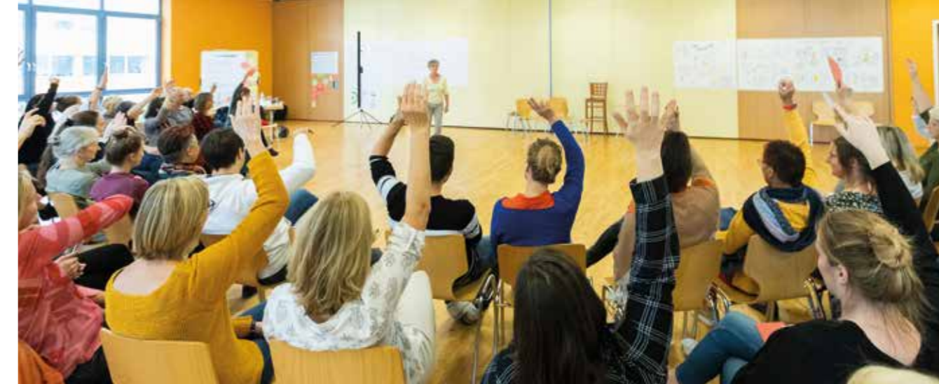
Die Mitarbeitenden sind beteiligt an Erfolg, Kapital und Entscheidungen.

die von Mitarbeitenden geführte bioverlag-Stiftung einspringen. Außer des monatlichen Bruttogehalts erhalten Mitarbeitende eine Erfolgsbeteiligung, welche gemeinsam auf Basis des Jahresabschlusses vereinbart wird. Diese wird im Verhältnis zur geleisteten Arbeitszeit ausgezahlt, was sich nivellierend auf das Gehaltsniveau auswirkt. Aktuell ist das höchste Gehalt im Verlag knapp dreimal so hoch wie das niedrigste. Die Mitarbeitenden haben für sich 35 Stunden als volle Wochenarbeitszeit definiert, u.a. um mehr Menschen beschäftigen zu können, und sie möchten sich selbst eine flexible Wochenarbeitszeit ermöglichen. Um dieses Ziel mit den gemeinschaftlichen und geschäftlichen Bedarfen in Einklang zu bringen, hat sich eine differenzierte Praxis zur Arbeitszeitorganisation entwickelt: Grundsätzlich können alle Mitarbeitenden unter Berücksichtigung der Arbeitserfordernisse in Abstimmung mit der Geschäftsleitung und den direkten Kolleg*innen ihre Arbeitszeit flexibel und ohne Kernzeit selbst organisieren. Für die notwendige Abstimmung in den Teams gibt es kein formelles