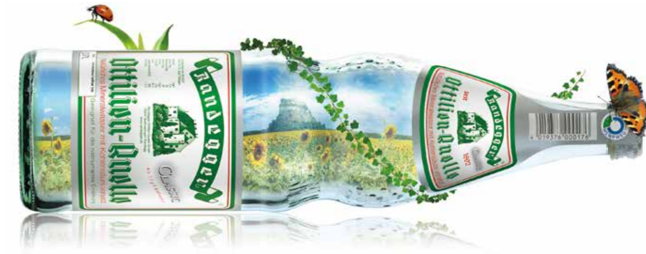
Perlenflasche: Kooperativ entwickelt – über 50 Jahre am Markt

Die Perlenflasche erhielt 2019 den 'German Design Award' in Gold, den renommiertesten Designerpreis Deutschlands: Ein Aufruf zur Trendumkehr nicht nur an die restlichen Getränkeproduzent*innen, sondern auch an produzierende Unternehmen in anderen