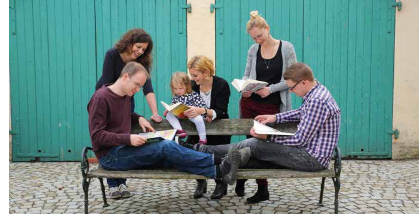
Hobby, Arbeit und Familie zusammen – das Buch7-Team

können auch kleine Vereine oder Gruppen unterstützt werden, die andere Fördermittel, wegen bürokratischer Hürden, nicht in Anspruch nehmen können. Beispiele geförderter Projekte: Das Inselhaus – Kinder- und Jugendhilfe in Eurasburg – hilft Kindern, die benachteiligt und durch familiäre Umstände in ihrer Entwicklung beeinträchtigt sind; foodwatch, die Lebensmittelkandale aufdecken; in Langweid, dem Firmensitz des Unternehmens, wurde der alte Bahnhof renoviert und ein gemeinnütziges Kulturzentrum gegründet. 2013 stieg der Umsatz auf 125.000 Euro, so dass der erste Gründer festangestellt werden konnte. Heute ist buch7 ein Unternehmen mit 14 Mitarbeitenden, über drei Millionen Euro Umsatz und einer kumulierten Spendenleistung von über 600.000 Euro, das entspricht etwa 75 Prozent des Gewinns. Trotz dieses Wachstums lebt das Team von buch7 weiterhin seinen idealistischen Traum, Spenden für wertvolle Projekte sozusagen aus dem „Nichts“ zu